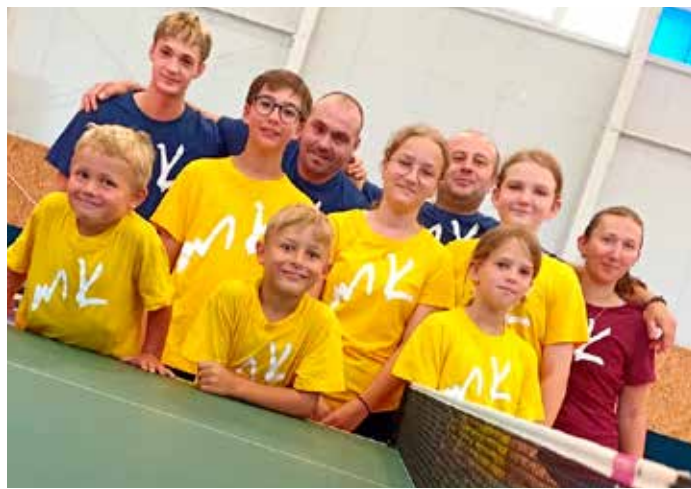
Soustředění Moravský Krumlov