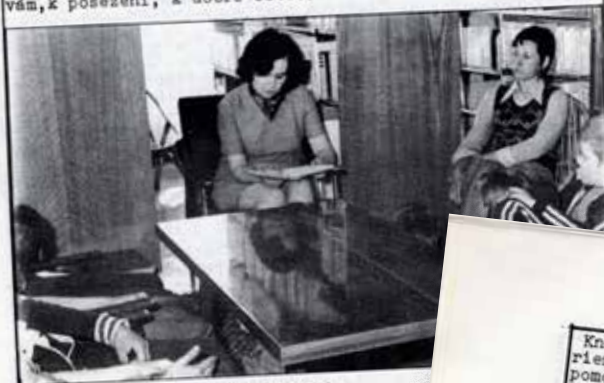
Při jedné z literárních besed. 10

Fond knížek však narůstá a najednou dosavadní místnost již nestačí. Některé knihy jsou pro nedostatek dlužného prostoru přestěhovány do skladu na radnici. Stoupá i počet čtenářů, počet výpůjček překračuje ročně 26 tisíc. Je rozhodnuto přistavit ke kulturnímu domu pro knihovnu novou místnost, a tak v únoru 1971 dostává knihovna nový stánek. Velká, světlá místnost je vybavena nábytkem podle architekta a návrhu, knihovnu zdobí originální obrazy zapůjčenými z hodonínské galerie, knihy jsou uspořádány přehledně, prosklené vitríny dovolují v malých výstavních pravidelně doporučovat nové knihy, krásné prostředí láká čtenáře k návštěvám, k posezení, k dobré četbě.