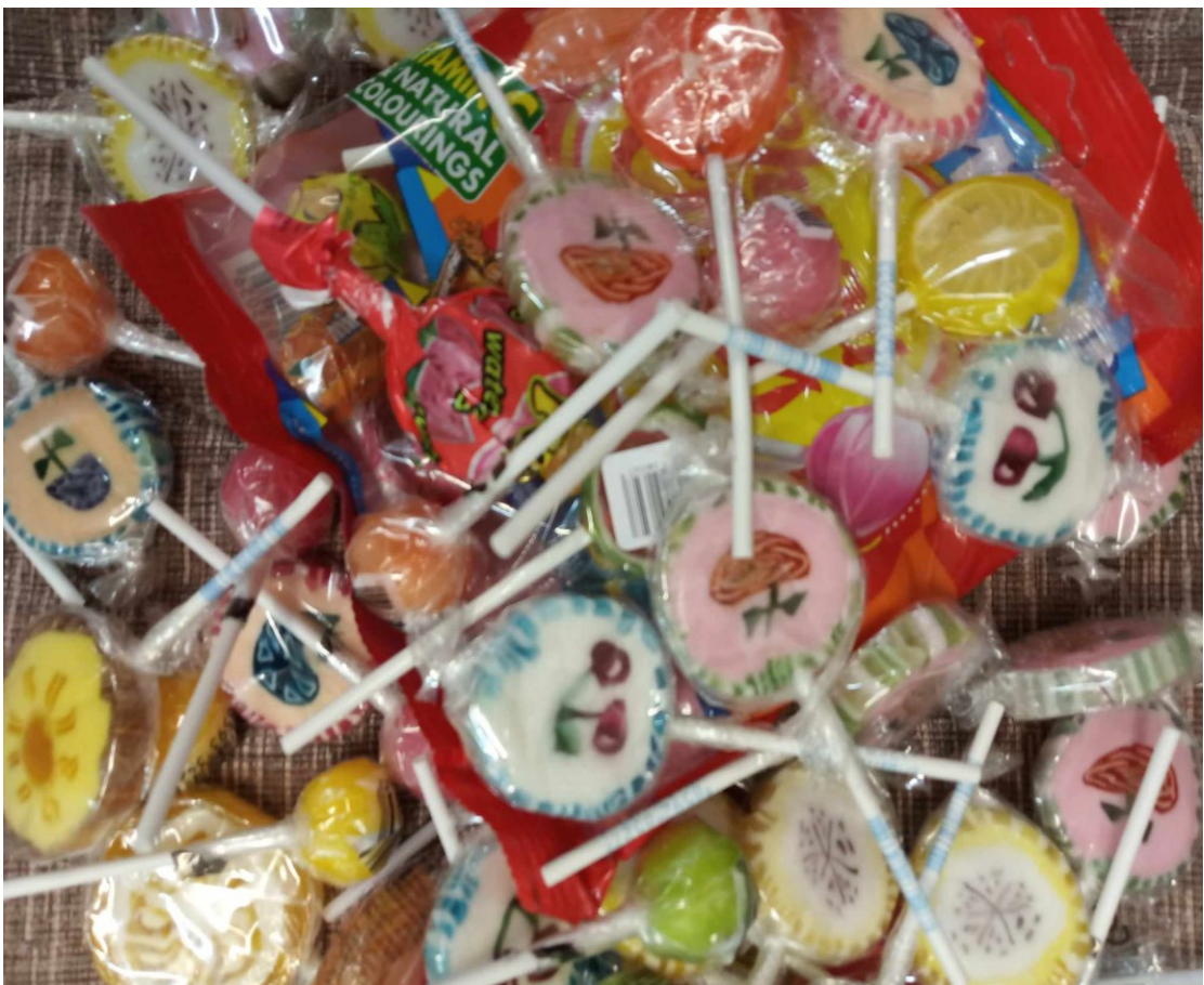
Obr. 4. Lízátko pro dětské onkologické pacienty