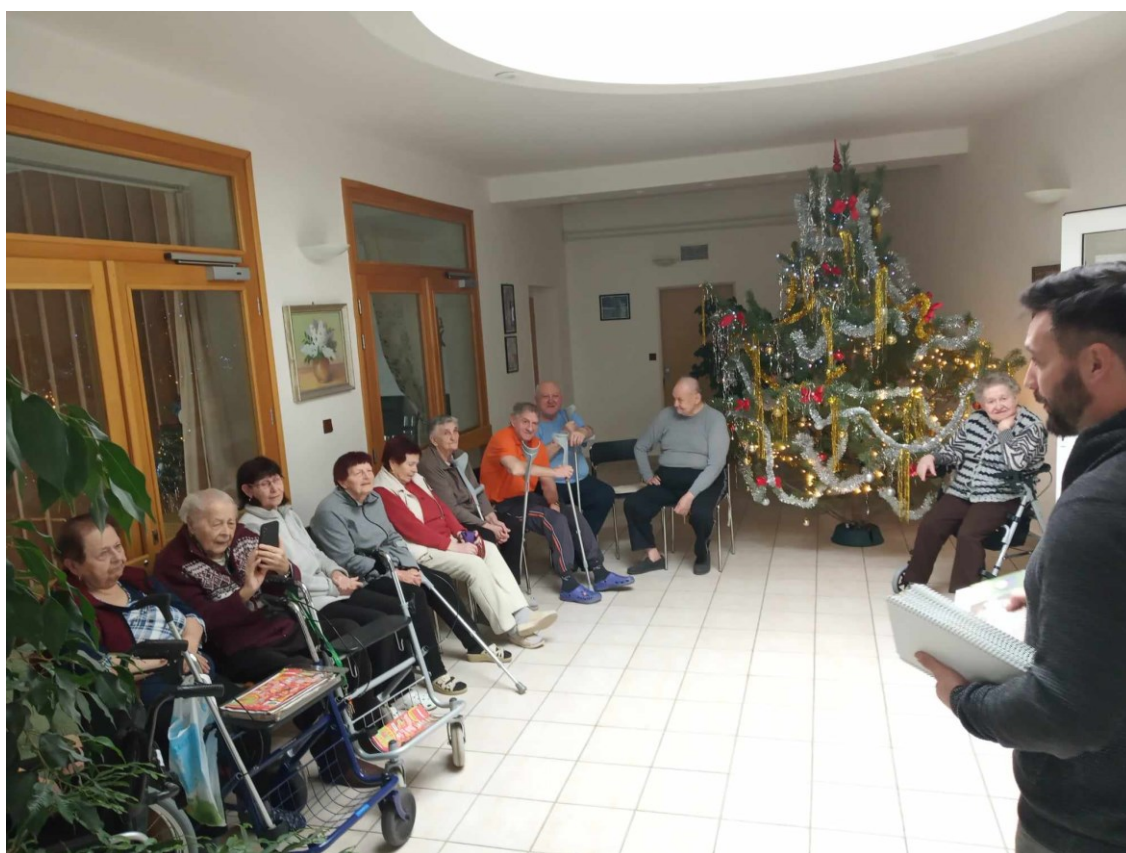
Obr. 7. Setkání obyvatel DPS s panem starostou