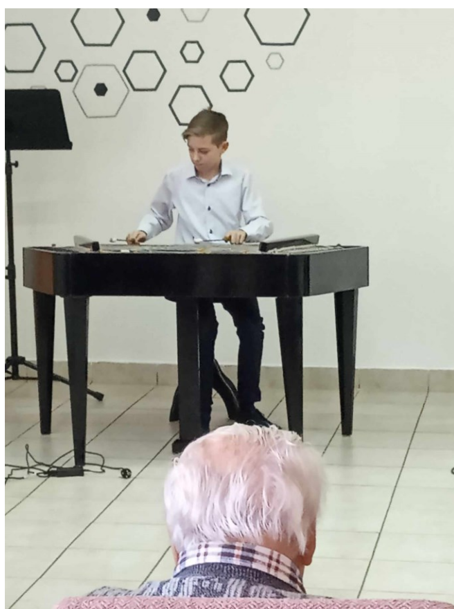
Obr. 6. Vystoupení žáků ZUŠ Vracov