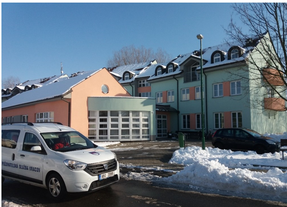
Obr. 1. Hlavní vchod DPS Vracov

Kde: - v domácím prostředí uživatele – území města Vracova - v prostorách budovy Domu s pečovatelskou službou ve Vracově