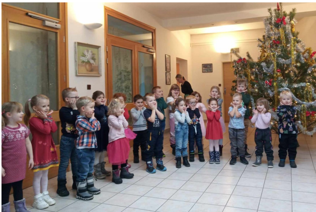
Obr. 5. Vystoupení dětí z Mateřské školy Vracov