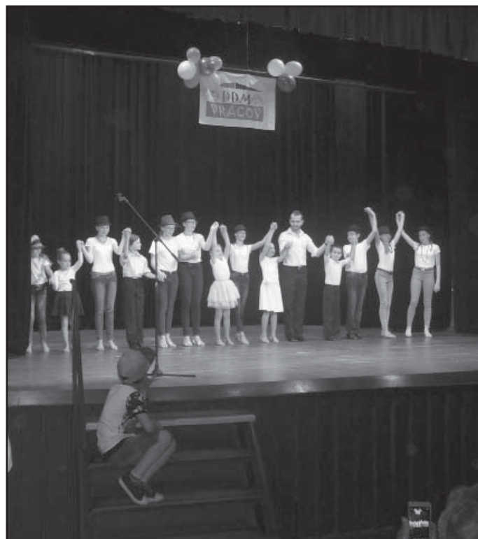
Tanec v proměnách