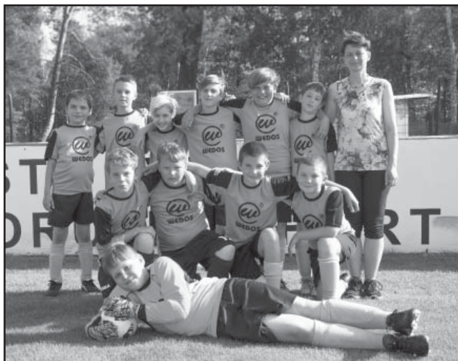
FKM MORAVA starší přípravka „B“