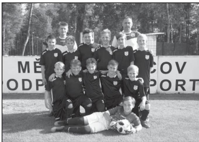
FKM MORAVA starší přípravka „A“ - 2. místo okresního přeboru Hodonín