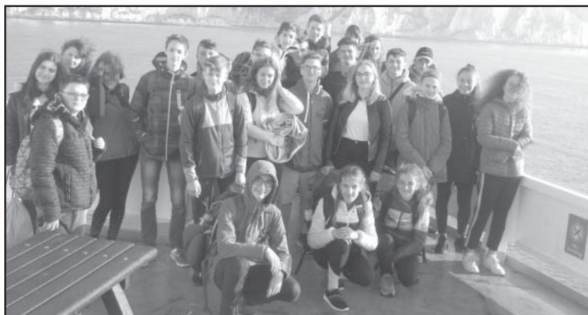
MZŠ v Anglii