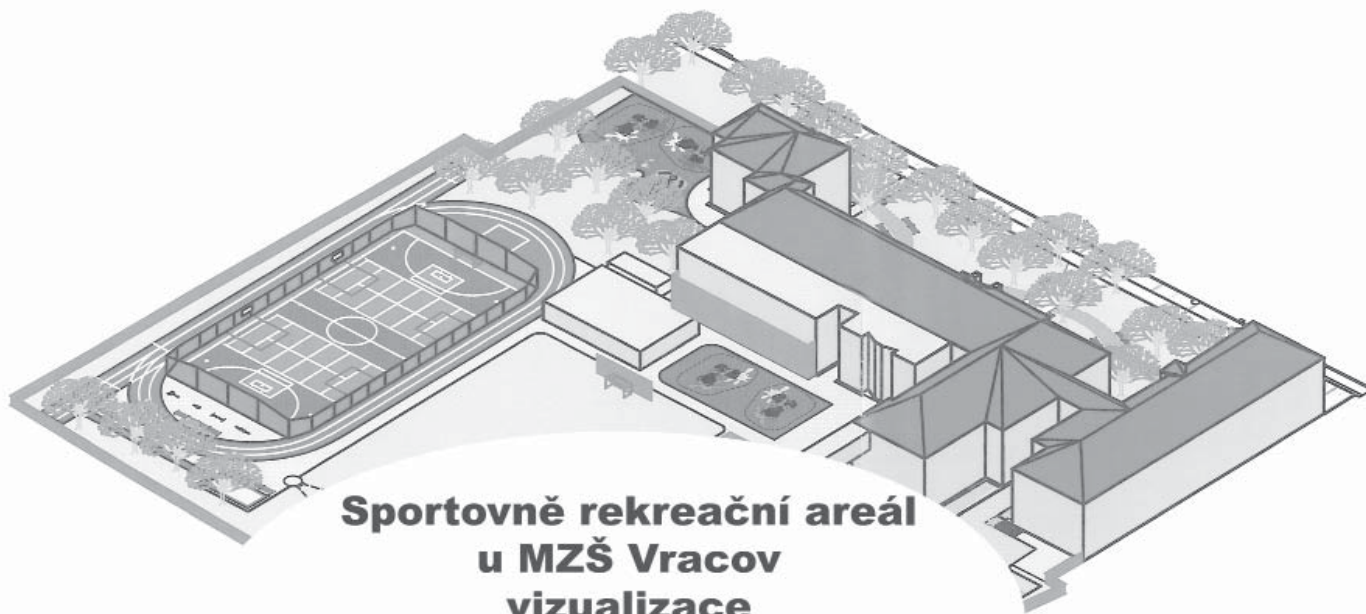
Sportovně rekreační areál u MZŠ Vracov vizualizace