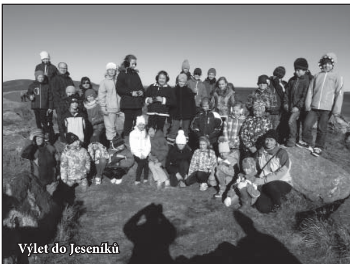
Výlet do Jeseníků

Den zdraví proběhl ve spolupráci se školní jídelnou. Menší děti si v jídelně školy připravily básničky, písničky, tanečky a soutěže o zdravé výživě. Se staršími žáky na toto téma besedovala dietní sestra z kyjovské nemocnice.